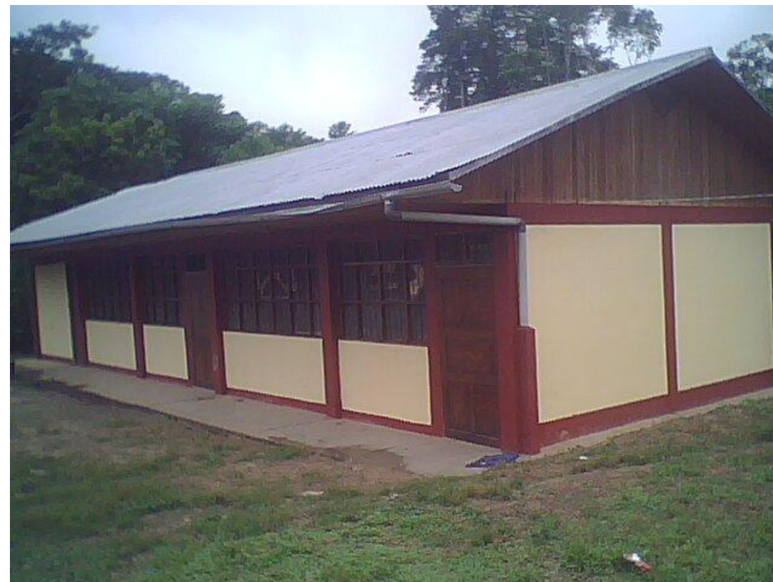
I.E. 34504 - Camantarma