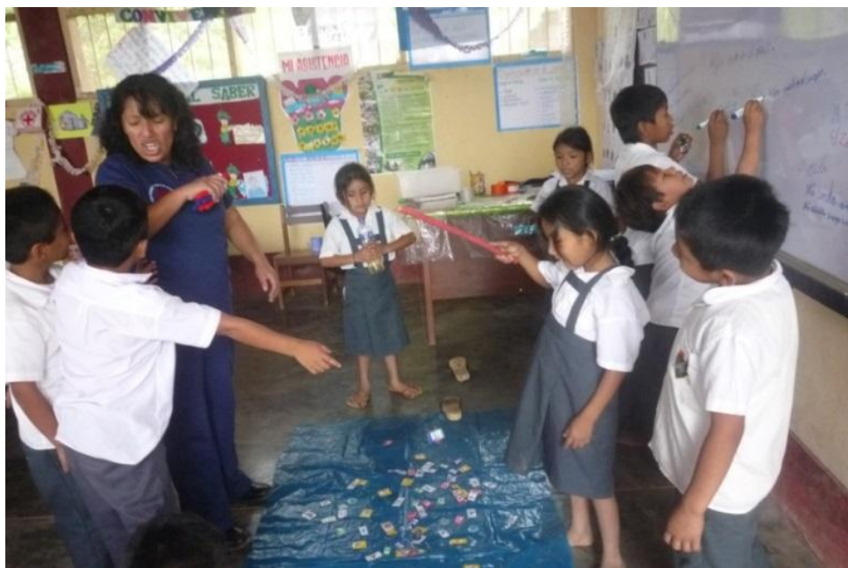
ALMUERZO 1:00 p.m.