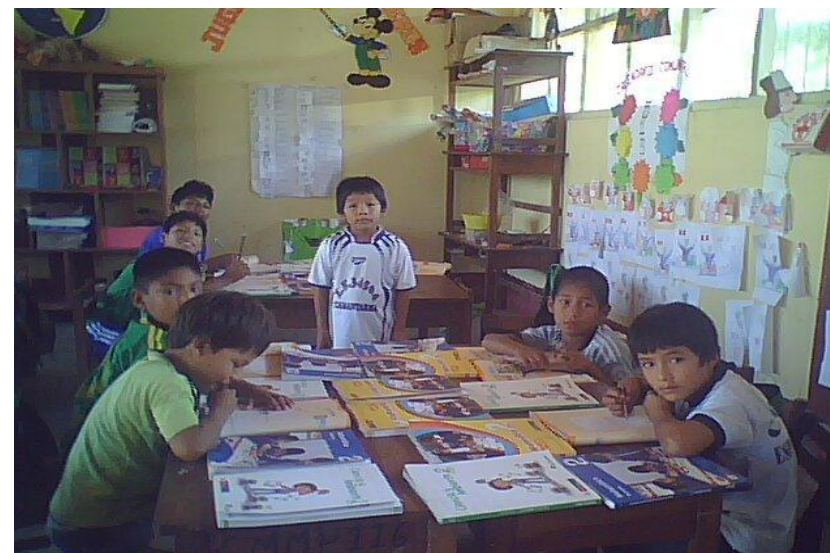
ASESORIA Y PREPARACIÓN DE CLASE 5:00 p.m.