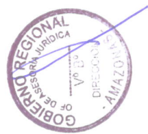
Fig. Ortiz Arrieta N° 1250 t: (041) 478132

Chachapoyas - Amazonas Central Telefónica 478131 - Anexo 283